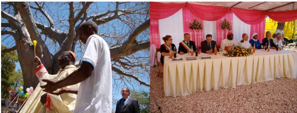
Il giorno dell'inaugurazione del nuovo reparto di Maternità dell'ospedale di Mbweni